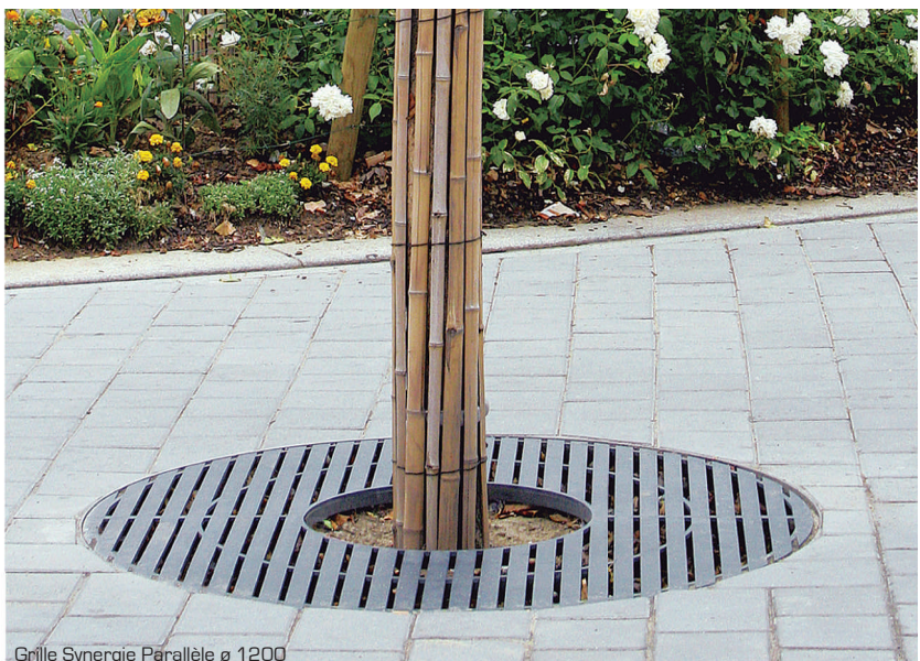
Grille Synergie Parallèle ø 1200

Grille tout acier réalisée en tôle épaisseur 8 mm et renforts en plat 25 x 6 mm. Composée de deux demi-éléments. Cadre en cornière acier 40 x 40 x 4 et rond ø 6 mm pour scellement Une partie du cadre pointé pour passage du tronc d'arbre.