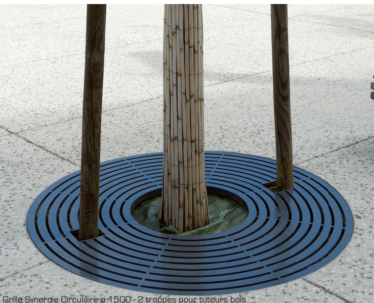
Grille Synergie Circulaire ø 1500 - 2 trappes pour tuteurs bois