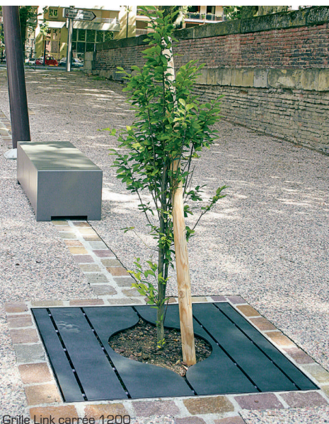
Grille Link carr e 1200