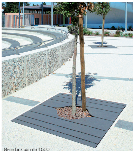
Grille Link carr e 1500