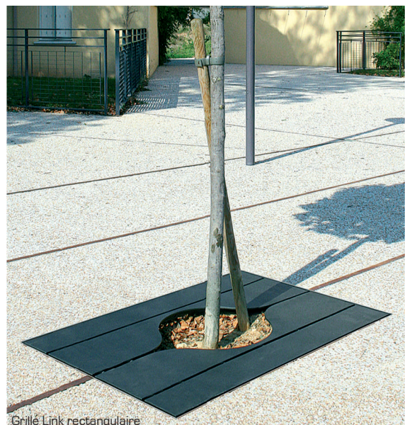
Grille Link rectangulaire

Grille tout acier r alis e en t le  paisseur 8 mm et renforts en rond \varnothing 20 et plat 30 x 5 mm. Compos e de deux demi- l ments.