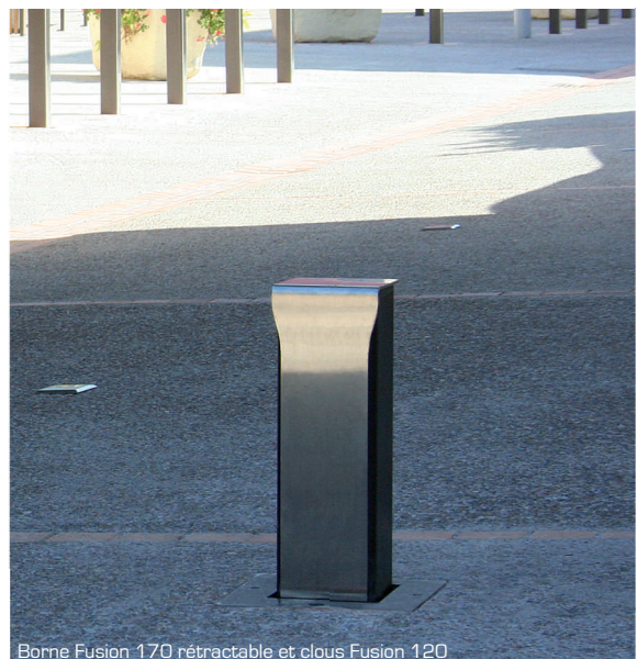
Borne Fusion 170 rétractable et clous Fusion 120

Clous réalisés en acier inoxydable 304L massif usiné. Tige de scellement M10 en inox 304L et tige anti-rotation soudées sous la tête.