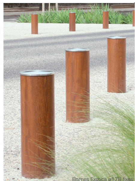
Bornes Exotica ø178 fixes

Bornes constitu es d'une t te en acier inoxydable 304L fix e sur un corps en bois exotique tourn . Syst me amovible tout inox 304L. Verrouillage par serrure quart de tour command e par cl  triangle de 9.