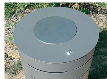
Option condamnation vigipirate