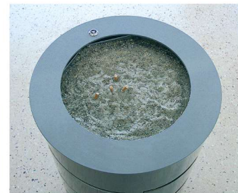
Cendrier Amandine Cylindrique